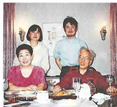
真鍋さん(左)と妻の真鍋さん(右)と長女(真鍋さん)と長男(真鍋さん)の4人。真鍋さんは「好奇心」を大切にしている。