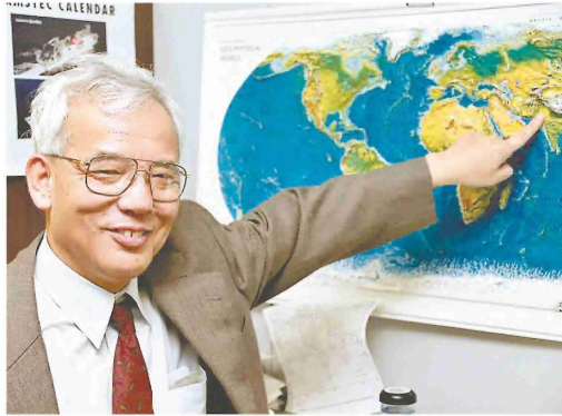
●世界地図を指さす真鍋さん。コンピュータによる地球気候モデルを開発した(2000年撮影) ●真鍋さん夫妻(手前)と沖教授夫妻(1966年、米国の真鍋さん宅で)

プリンストン(米ニュージャージー州)に船越る。米東部時間05日午前11時。米東部時間05日午前5時、日本時間同日午後6時、真鍋さん(90)が、ノーベル物理学賞を受賞した。真鍋さんは、発表の直後、自宅で読売新聞の単独インタビューに応じ、「約60年の研究の原動力は好奇心」と満面の笑みを浮かべた。